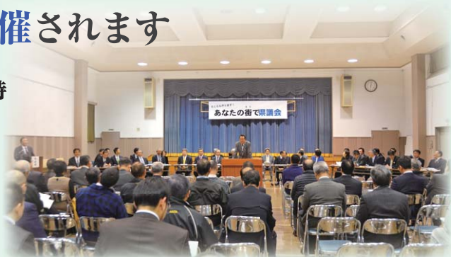
平成27年11月・大曲交流センター（大仙市）

秋田県議会では、議会改革の取組の一つとして、「開かれた議会」を目指し、県政に関する県民の皆様の意見などを伺い、今後の議案の審査や議会運営に反映していくため、意見交換会を開催します。