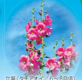
立葵(タチアオイ)／6～8月頃 梅雨入り頃から花が咲きはじめ、上部の花が咲くと、梅雨が明けるといわれています。