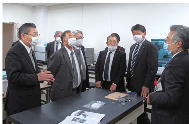
県健康環境センターでPCR検査の状況を調査