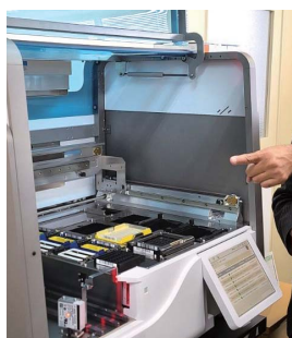
全自動の検査機器

今後も感染予防対策を県民の皆さんに呼びかける広報活動、PCR等の検査態勢の拡充、仮設診療所の開設、病院や福祉施設の設備の充実に努めるとともに、経済活動の停滞により影響を受けている皆さんへの相談・支援を行います。