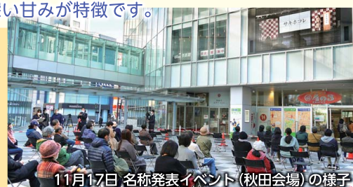
11月17日 名称発表イベント（秋田会場）の様子

県では、名称周知のためのキャンペーンを展開したほか、令和3年1月からは各地域毎に栽培技術研修会を開催する予定。認知度の向上と併せて、食味と品質をしっかりと確保できる生産体制を整備し、令和4年のデビューを目指すことにしています。