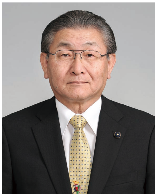
福祉環境委員長 議会運営委員